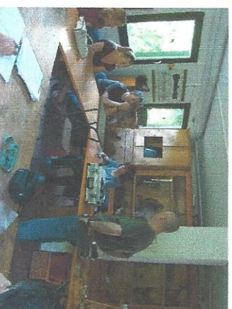
Lehraum am Forsthaus Kurk

Dem gesamten Lehrgang liegt die Überlegung zu Grunde, dass die Theorie die praktische Einweisung im Revier nicht ersetzt. So finden daher neben den regelmäßig stattfindenden Lehrgangsabenden, zweimal wöchentlich dienstags und donnerstags, Reviergänge statt, bei denen die angehenden Jungjäger ihr theoretisches Wissen in die Praxis umsetzen und durch praktische Übungen vertiefen können. Bereits zu Beginn des Lehrgangs haben Sie Anschluss an die Hagerer Jägerschaft.